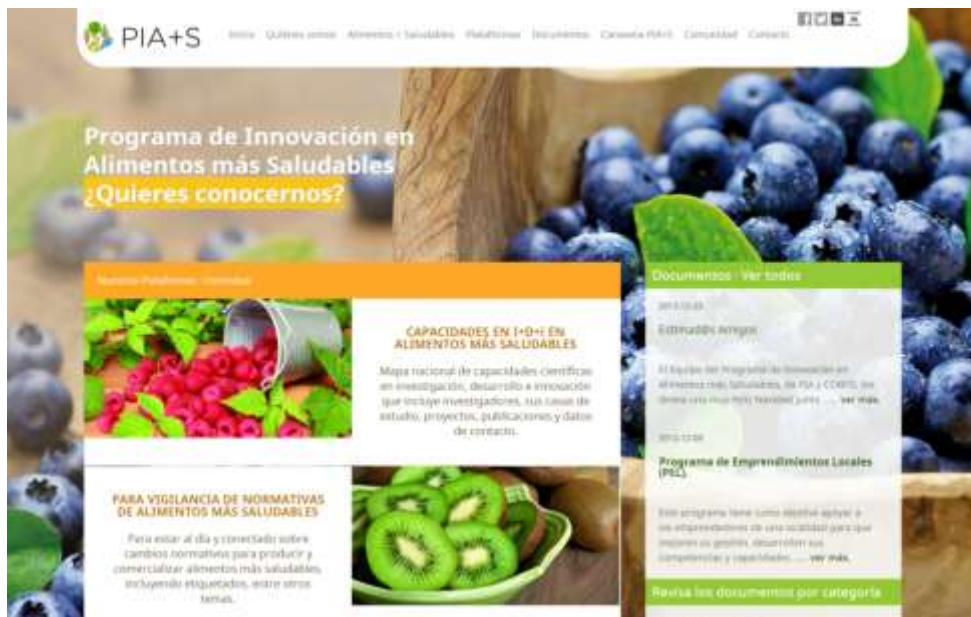
Imagen 1: Repositorio virtual, www.piaschile.cl , donde se facilita toda la información en las temáticas de tecnología, normativa y mercado a la comunidad.

Durante este año se está trabajando para completar el núcleo de mercado el cual se está trabajando desde fines del 2013 y que espera dar a luz en marzo del 2014 y así cumplir con el objetivo propuesto inicialmente de abarcar los tres núcleos de información.