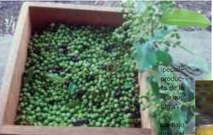
special- produc- to de la nieve a que algia".