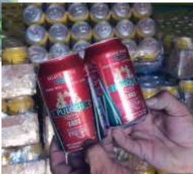
oductos en azu- ro, jara- a agave.