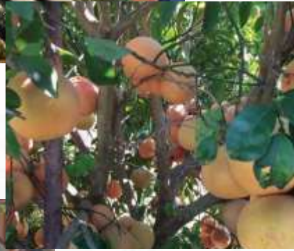
preando técnicas orgánicas.

Debido a la alta calidad de los nejo orgánico adecuado, la cos 2016 del lote Los Castores puc Japón. Actualmente la Sociedad exportando a través de las empr con las que ha firmado contrato ción de las toronjas se realiza a t que procesan la fruta para la ele o para su presentación en gajo: