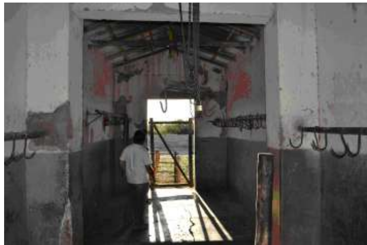
Situación actual de mataderos

La sala de faena móvil es un modelo productivo con valores inclusivos y federales que apunta a la democratización de los medios de producción, promoviendo la innovación al alcance de todos . En un contexto de cooperación y articulación interinstitucional en el diseño y aplicación de políticas públicas que reúnen entre sí actores públicos, privados y las organizaciones de la agricultura familiar campesina y pequeños productores, apuesta al desarrollo territorial rural, la distribución de la riqueza con equidad, y la generación de empleo en los diferentes ámbitos.