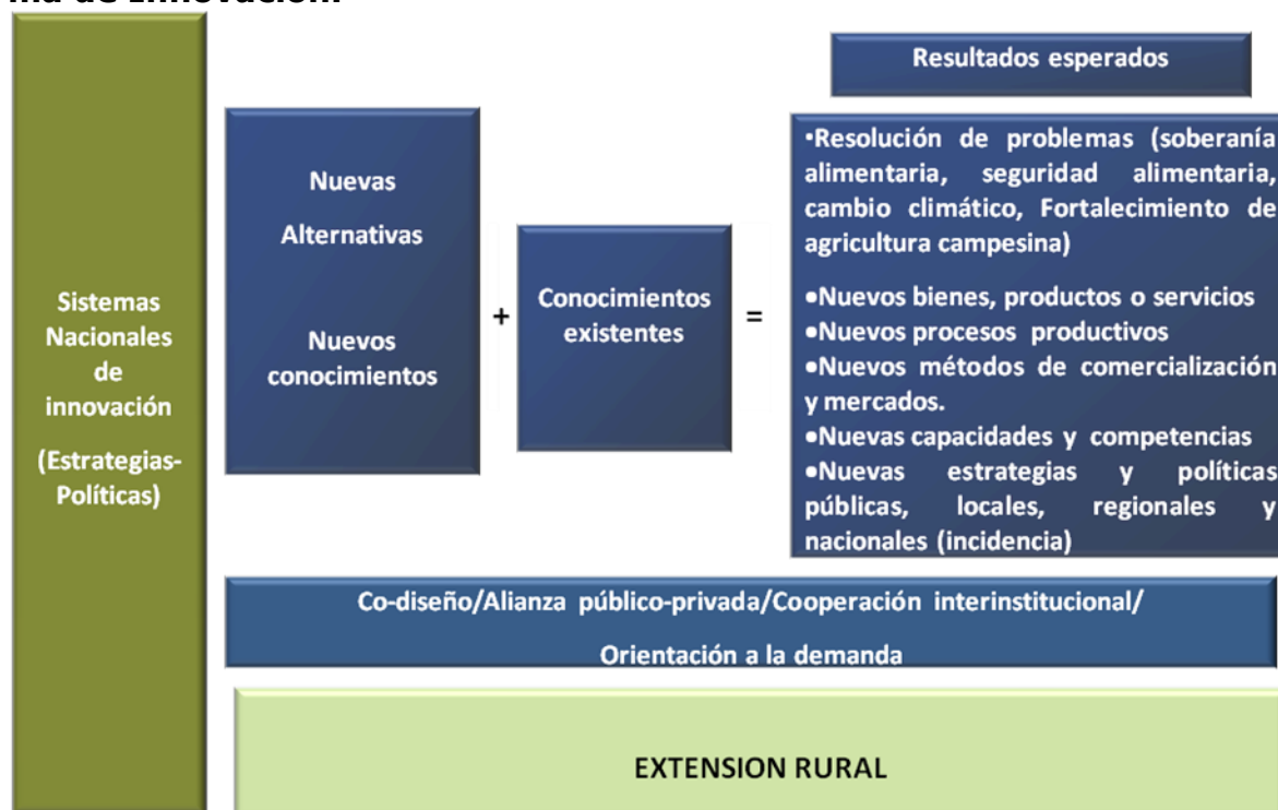
Figura 2: Esquema respecto al rol de la Extensión rural como parte de un Sistema de Innovación.

Según se observa en el lado izquierdo de la Figura 2, se hace referencia a los Sistemas Nacionales de innovación (SNI), los cuales tienen varias y distintas definiciones. Nos parece de interés citar una que en el sentido más amplio indica que los SNI son todo aquello que afecta la capacidad innovativa, la actitud innovativa y las posibilidades de innovar en un espacio nacional 8 . Esta mirada permite englobar a todos los actores y todos los espacios relacionados con la innovación y el término "sistema" posibilita el referirse a la red de vínculos de cooperación entre usuarios y productores. Esta red pasa por la búsqueda conjunta del aprendizaje mutuo y culmina en avances tecnológicos determinados, así como en la creciente capacidad de todo el conjunto para identificar posibilidades de innovación y realizarlas.