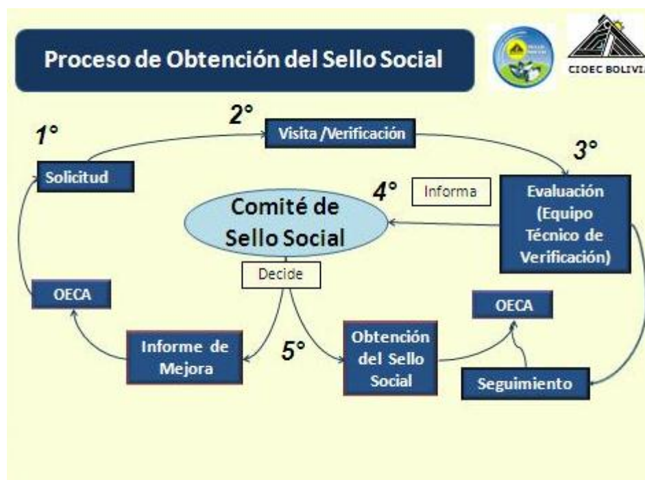
Figura 3. Proceso para la obtención del Sello Social

El proceso para obtener el Sello Social considera 5 pasos. Comienza con una solicitud para acceder a éste, continúa con una visita (verificación) que tiene como objetivo obtener las evidencias del cumplimiento de los requisitos y evaluarlas de forma objetiva. Esta visita está a cargo de los "facilitadores", personal encargado de la labor de verificar y orientar a los asociados de las OECAs sobre el cumplimiento de los requisitos del sello social. Posteriormente un Equipo Técnico de Verificación, conformado por un grupo multidisciplinario, tiene la función de verificar y garantizar mediante controles que las OECAs cumplen con los principios del sello social. Este grupo emite un informe destinado al Comité de Sello Social, integrado por representantes de los diferentes sectores de las OECAs, que tienen la facultad de otorgar el sello social, previa revisión de los informes provistos por el Equipo Técnico de Verificación. Cabe destacar que en la situación que un miembro del Comité de Sello Social tuviera algún tipo de relación con una OECA a ser certificada, este miembro se excusa en su voto.